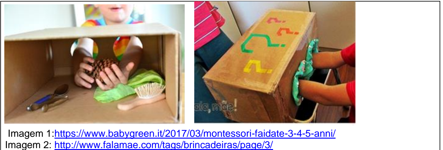
Imagem 1: https://www.babygreen.it/2017/03/montessori-faidate-3-4-5-anni/

Imagem 2: http://www.falamae.com/tags/brincadeiras/page/3/