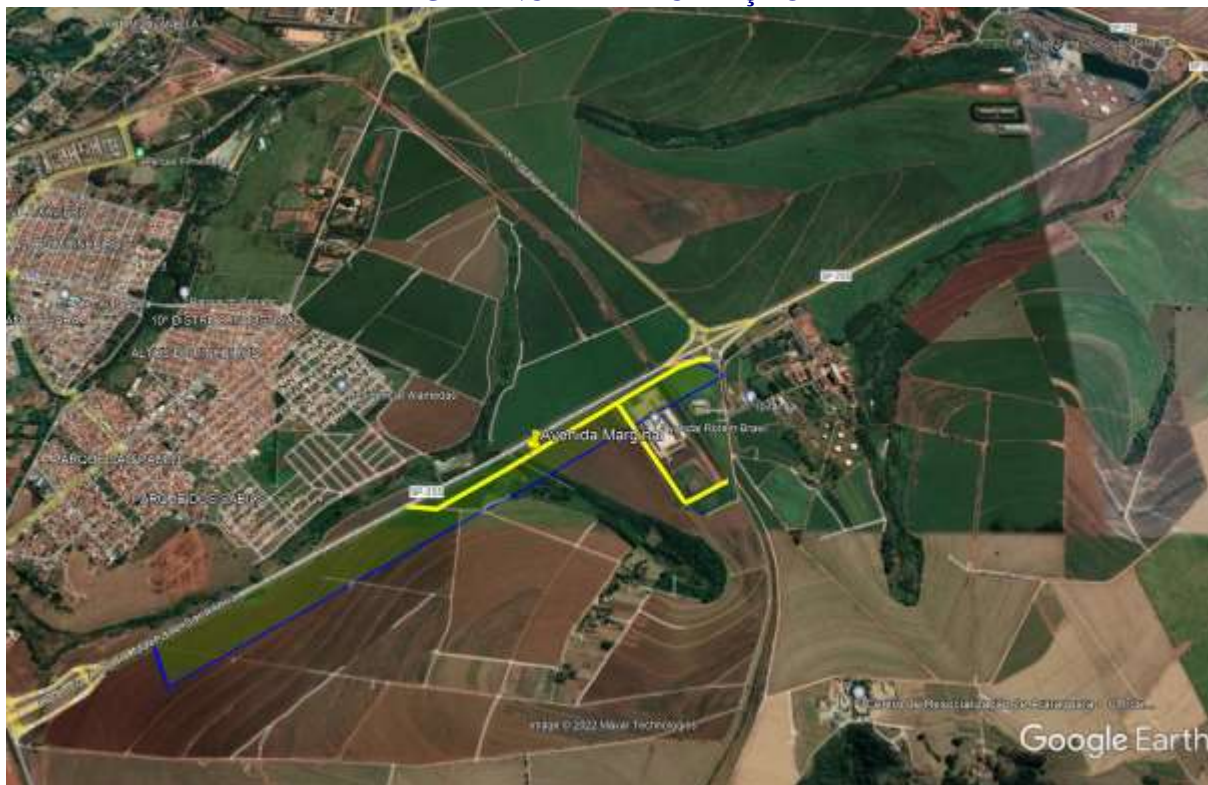
Localização do Empreendimento (Google Earth)